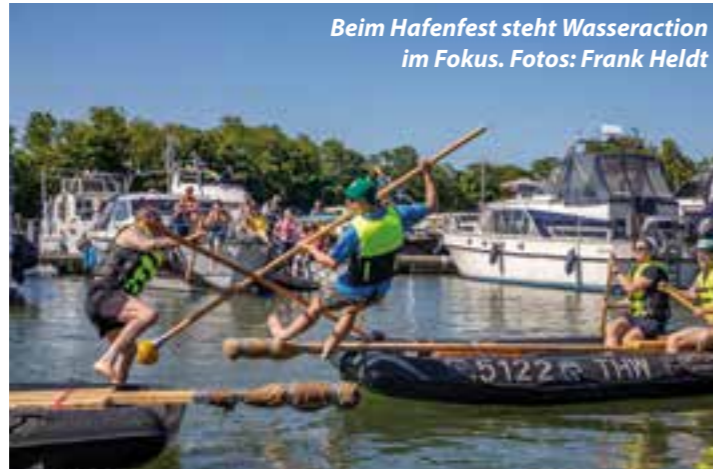
Beim Hafenfest steht Wasseraction im Fokus.

Seit über 20 Jahren begeistert das Hafenfest Jahr für Jahr mehrere zehntausend Besucherinnen und Besucher. 1999 ins Leben gerufen, hat sich die Veranstaltung längst zu einem echten Publikumsmagneten für Wassersportfans und erlebnisfreudige Familien entwickelt. In diesem Jahr findet das Hafenfest von Freitag, 5. Juni, bis Sonntag, 7. Juni, statt.