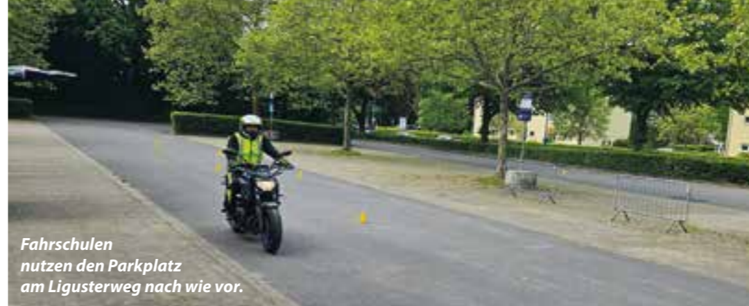
Fahrschulen nutzen den Parkplatz am Ligusterweg nach wie vor.

Aktuell zahlt die Fahrschule Rasant im Monat fix 100 Euro für vier Kennzeichen, die sie auf dem Parkplatz beliebig häufig benutzen kann. Wenn man die restlichen zwölf Fahrzeuge inklusive Motorräder auch noch dort anmelden würde, würden die Kosten für insgesamt 16 Fahrzeuge auf 400 Euro für acht Stellplätze ansteigen. Wenn man aber nur zwei Fahrzeuge anmeldet und mit den anderen Fahrzeugen rauf und runter fährt, summieren sich die Kosten auch mehr und mehr. Die Fahrschule Rasant zahlt pro Parkplatz 50 Euro, den sie mit zwei Kennzeichen befahren darf. Zudem bezahlt sie für jede angefangene Stunde bezahlt 1 Euro.