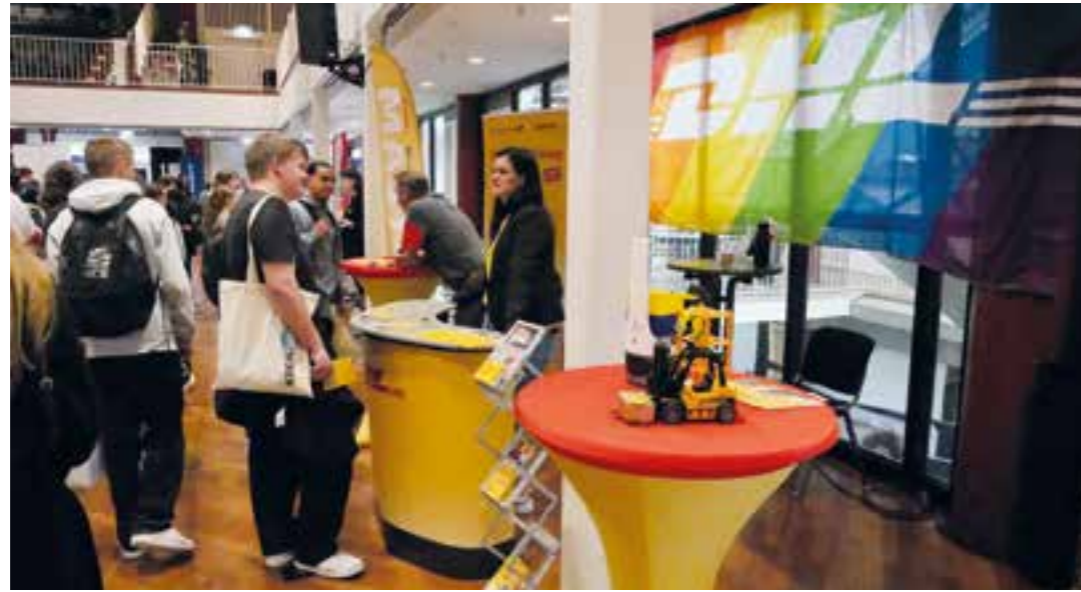
Beim BSO ist der Andrang groß.

Ausbildung oder Studium? Was in der Region möglich ist, zeigt der Berufs- und Studienorientierungstag (BSO) des Kreises Unna am Mittwoch, 24. Juni. Er findet von 9 bis 14.15 Uhr auf dem „BSO-Campus“ in Unna statt.