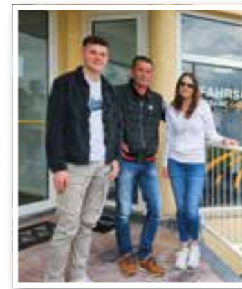
Story des Monats Seite 4 Fahrschulen