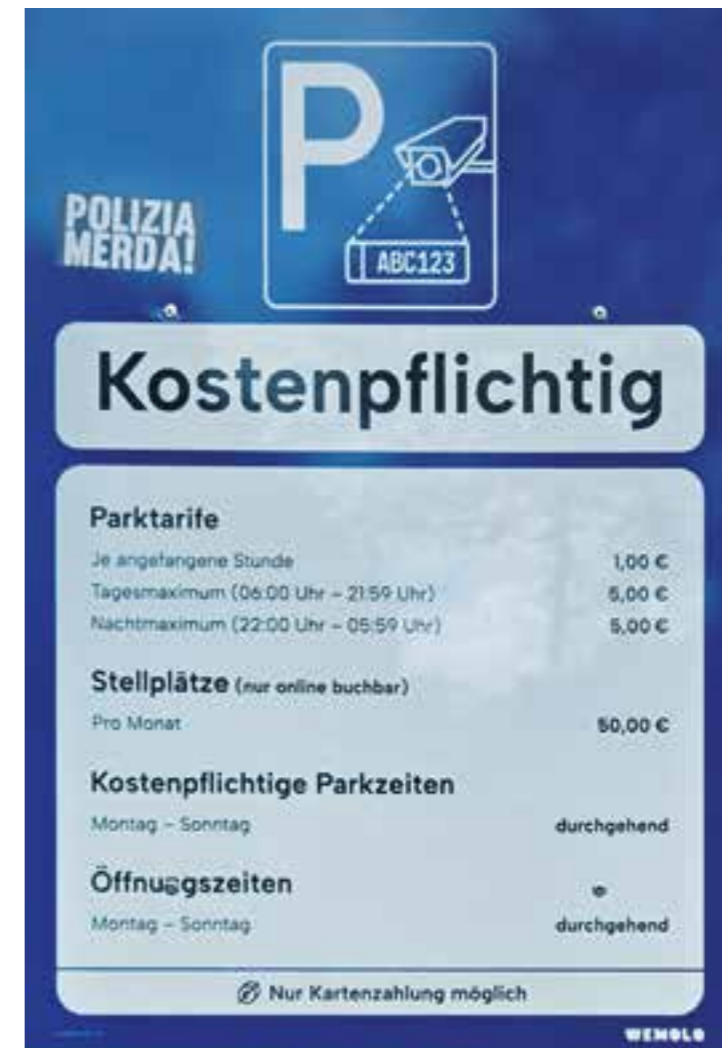
Die kostenpflichtigen Parkplätze sind längst ausgeschildert.