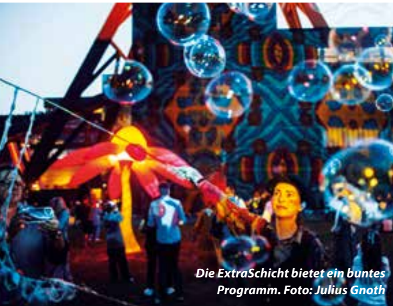
Die ExtraSchicht bietet ein buntes Programm.

Einmal im Jahr verwandelt sich das Ruhrgebiet in eine riesige Kulturkulisse – bei der ExtraSchicht, der Nacht der Industriekultur. Am 27. Juni ist es wieder soweit: Von 18 bis 2 Uhr öffnen zahlreiche Spielorte ihre Tore und laden Besucher zu einem einzigartigen Erlebnis zwischen Vergangenheit und Moderne ein.