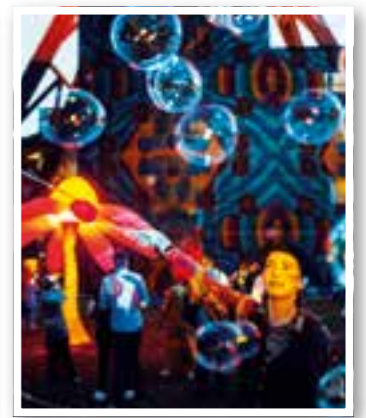
Region Seite 28 Extraschicht

Impressum Ortszeit Kreis Unna Herausgeber und Verlag: FKW – Fachverlag für Kommunikation und Werbung GmbH Delecker Weg 33 59519 Möhnese-Weppingsen Telefon: 02924/87 970-0 Telefax: 02924/87 970-29 E-Mail: info@fkwverlag.com