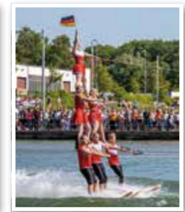
Bergkamen Seite 6 Hafenfest