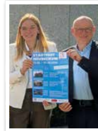
Beckum Seite 4 Stadtfest Neubeckum