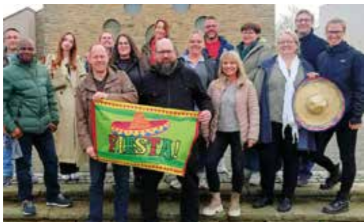
Musik, Familienprogramm und gute Stimmung verspricht das Orga-Team der Fiesta Mexicana in Ahlen.

Am Samstag, 13. Juni, heißt es in Ahlen wieder: „Fiesta Mexicana“. Bereits zum zehnten Mal verwandelt sich die Gemmericher Straße in eine lebendige Festmeile. Für das Event wird die Straße komplett gesperrt – dann übernehmen Familien, Kindergärten, Schulen, lokale Vereine, das JUK-Haus und das Stadtteilbüro Ahlen das Zepter.