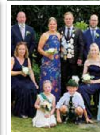
Ahlen Seite 8 100 Jahre Gemütlicher Westen