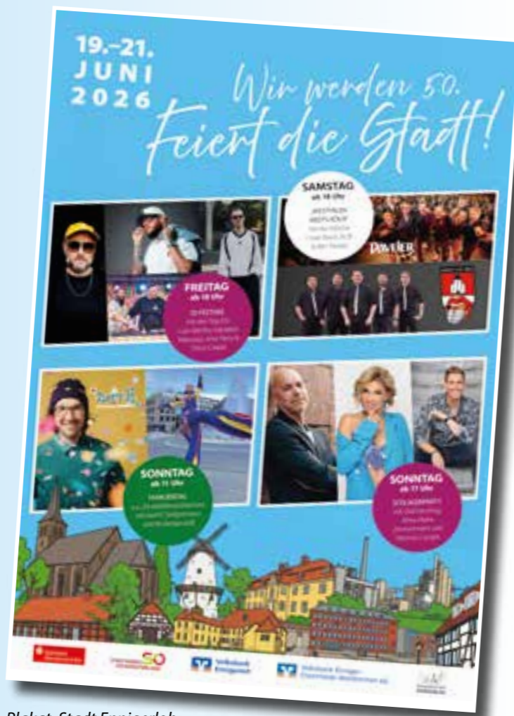
Plakat: Stadt Ennigerloh

Familienprogramm Der Freitagabend des Jubiläumswochenendes steht unter dem Motto eines entspannten Sommerabends. Mit Musik vom DJ, gemütlichen Sitzmöglichkeiten und lockerer Atmosphäre soll das Festwochenende in Ruhe eingeläutet werden. Am Samstag startet das Programm am Nachmittag mit Kaffee und Kuchen. Verschiedene Spielmannszüge sorgen dabei für musikalische Unterhaltung auf dem Platz. Später am Abend wird es dann deutlich stimmungsvoller, wenn die Kölner Band „Die Paveier“ auf der Bühne steht. Im Anschluss übernimmt eine Kölsche Co-Verband aus Everswinkel das musikalische Programm. Da die deutsche Fußballnatio-