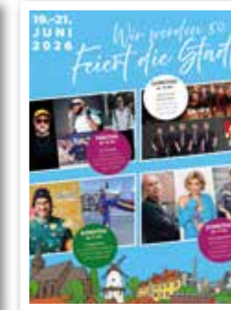
Ennigerloh Seite 14 50 Jahre Stadtrechte