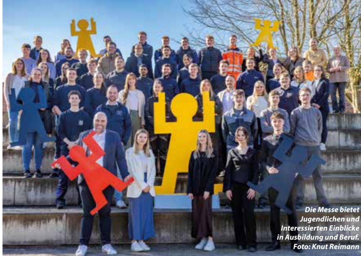
Die Messe bietet Jugendlichen und Interessierten Einblicke in Ausbildung und Beruf.

76 Unternehmen und Einrichtungen zeigen dort ihre Angebote und geben Einblicke in Ausbildung und Karrierewege aus Industrie, Handwerk, Gesundheitswesen, Handel und Verwal-