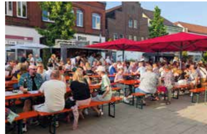
Das Winzerfest lädt zum Genießen ein.

Besonders vertreten sind unter anderem die traditionsreiche Moselregion sowie die Rheinhessische Schweiz, die für ihre hochwertigen und vielfältigen Weine bekannt sind. Besucherinnen und Besucher dürfen sich auf eine große Auswahl freuen – von frischen, fruchtigen Weißweinen bis hin zu kräftigen Rotweinen ist für jeden Geschmack etwas dabei. Doch