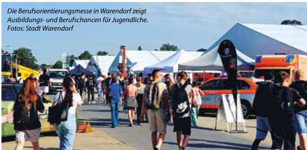
Die Berufsorientierungsmesse in Warendorf zeigt Ausbildungs- und Berufschancen für Jugendliche.

präsentieren sich und geben Einblicke in Handwerk, Technologie, Dienstleistungen und kreative Berufe. Die Besucherinnen und Besucher können direkt mit Unternehmen ins Ge-