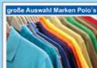
große Auswahl Marken Polo's

Wir haben die Überhänge bekannter Marken besonders günstig aufkaufen können. Wir geben diesen Preisvorteil an Sie weiter! Vieles zum 1/2 Preis reduziert!