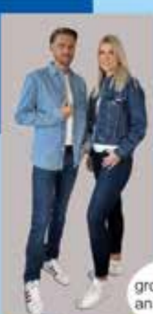
große Auswahl an Jeanshosen

Kommt in die große Bessmann-Modewelt! Markenkleidung für Groß & Klein zu Familien-Outletpreisen.