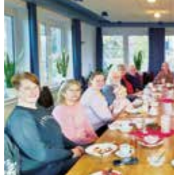
Gemeinsames Kaffeetrinken und Kuchenessen

Das Mehrgenerationenhaus Beckum bietet derzeit rund 35 regelmäßige Angebote für alle Genera-