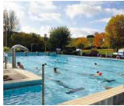
Freibad Gaßbachtal startet am 14. März mit 28 Grad warmem Wasser in die Saison.

mit hohem Badekomfort. Jedes Jahr zieht das Freibad zahlreiche Gäste aus dem Kreis Warendorf sowie aus Hamm, Gütersloh, Paderborn, Bielefeld und Lippstadt an. Viele Besucher kommen regelmäßig wieder, da es in der Umgebung kaum vergleichbare Angebote gibt. Kinder bis zu drei Jahren haben freien Eintritt. Das 25 Meter lange und 12,5 Meter breite Schwimmbecken bietet ideale Bedingungen für sportliche Bahnen ebenso wie für entspanntes Schwimmen. Auch bei kühleren Temperaturen bleibt der Weg ins Wasser angenehm: Über eine Schleuse gelangen die Badegäste direkt von den Duschen ins Becken, ohne durch kalte Außenluft gehen zu müs-