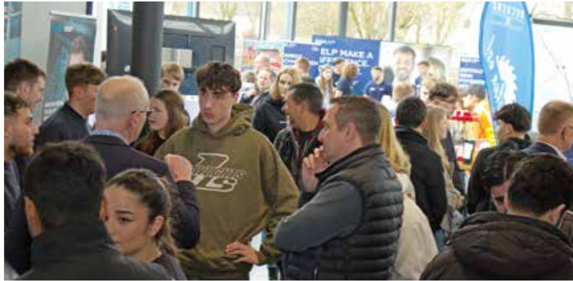
Besucher informieren sich auf der Tahlent 2026 über Ausbildungs- und Karrierechancen in der Region.

Am Samstag, 21. März, öffnet sie von 10 bis 14 Uhr ihre Türen im Autohaus Senger, Am Vatheuserhof 3, und lädt Schülerinnen und Schüler, Eltern und alle Interessierten dazu ein, sich umfassend über berufliche Perspektiven in der Region zu informieren. Mit über 80 Ausstellern aus unterschiedlichsten Branchen zählt die Tahlent zu den wichtigsten Veranstaltungen zur Berufsorientierung im Raum Ahlen. Unternehmen, Institutionen und Bildungseinrichtungen präsentieren hier nicht nur ihre Ausbildungsangebote, sondern auch duale Studiengänge, Prakti-