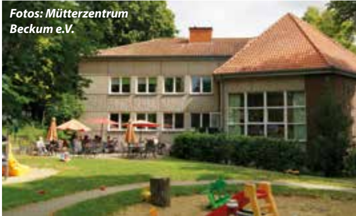
Das Mütterzentrum mit Garten