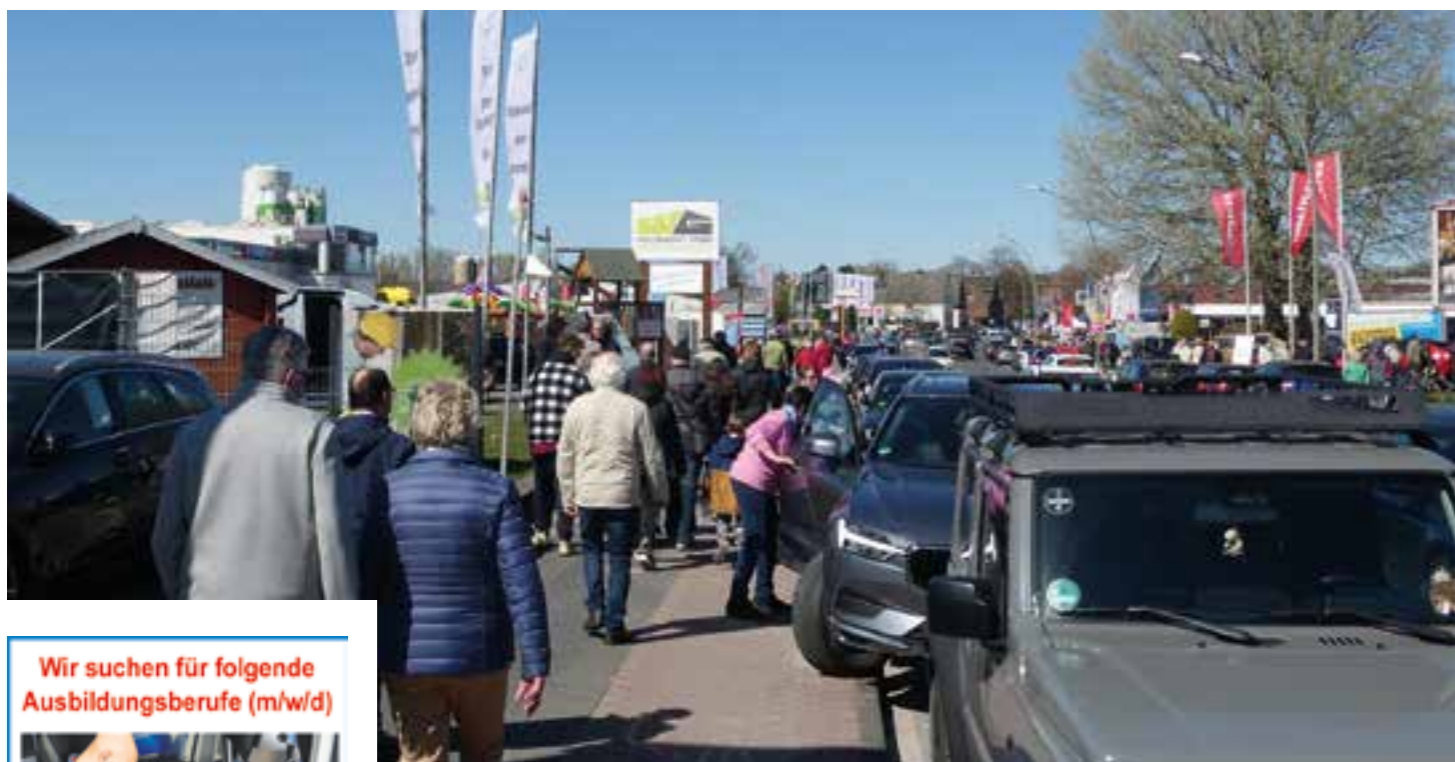
Zur 25. Beckumer Automeile laden die beteiligten Autohäuser am Sonntag, 22. März, in der Zeit von 10 bis 17 Uhr rund um die Neubeckumer Straße ein.

Wir suchen für folgende Ausbildungsberufe (m/w/d)