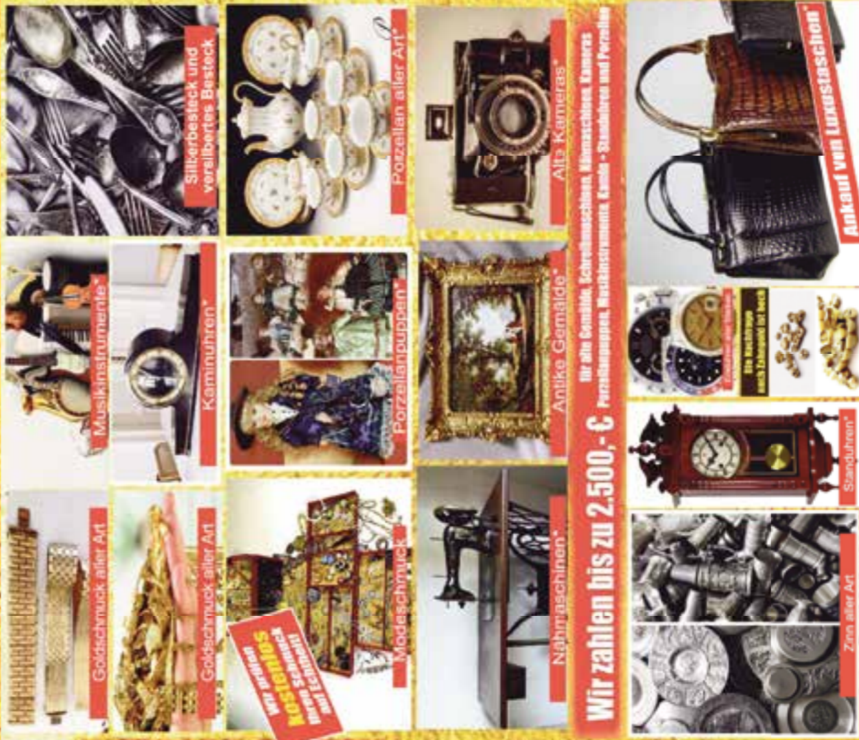
Silberbesteck und versilbertes Besteck Porzellan aller Art Alta Kameras Musikinstrumente Kaminuhren Antike Gemälde Wir zahlen bis zu 2.500,- € für alle Gemälde, Schreibmaschinen, Minischreiben, Kameras, Perstempel, Rechtsinstrumente, Kasse - Ständchen und Perzelle Nähmaschinen Wir zahlen bis zu 2.500,- € für alle Gemälde, Schreibmaschinen, Minischreiben, Kameras, Perstempel, Rechtsinstrumente, Kasse - Ständchen und Perzelle Modeschmuck Zinn aller Art Ständchen Ankauf von Luxusmaschinen Ihr Restschmuck auch Edelmetalle im Verkauf

Ankauf von Lederjacksen, Ledermäntel und Lederwaren aus Clair- und Whiteleder auch Lammfellböden zum Höchstpreis bis zu 2.000 €