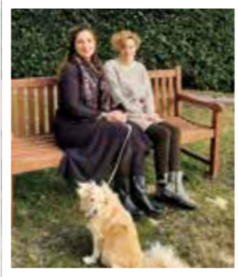
Beckum Seite 4 Mehrgenerationenhaus