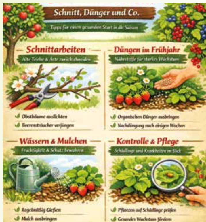
Grafik: F.K.W. Verlag

Der Jahreswechsel bringt Licht und Wärme, und die Pflanzen beginnen zu wachsen und brauchen jetzt guten Startvorteil. Frühjahrsmaßnahmen beeinflussen nicht nur die Ernte, sondern auch Gesundheit und Lebensdauer