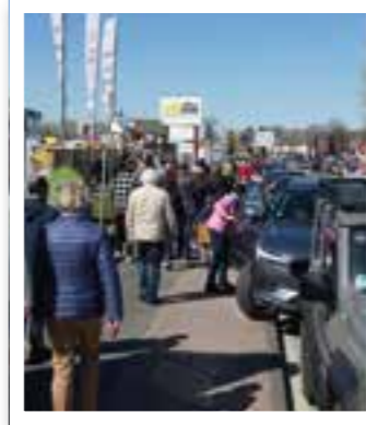
Beckum Seite 6 Automeile