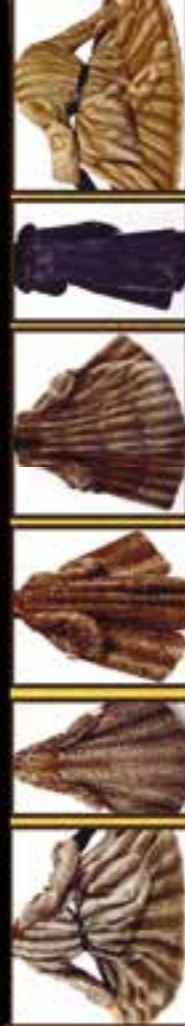
Bisam • Persianer • Fuchspeiße aller Art • Zobel • Nerze • Nutria • Chincilla