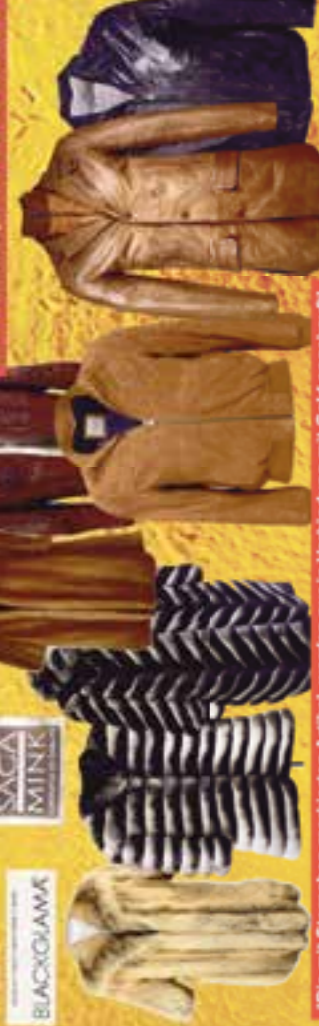
BLACKGLAMA SAGA MINK

*Die mit Sternchen markierten Artikel, werden nur in Verbindung mit Gold angekauft!