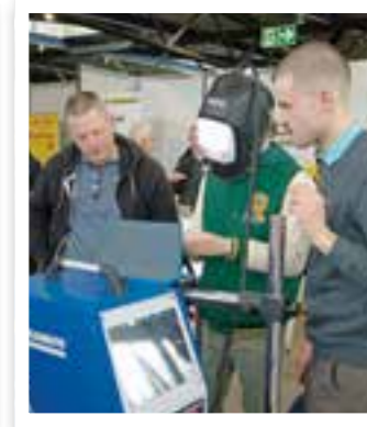
Ahlen Seite 12 TAHLENT