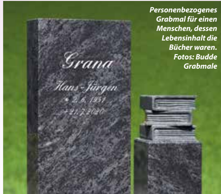
Personenbezogenes Grabmal für einen Menschen, dessen Lebensinhalt die Bücher waren.

Ein Grabstein markiert nicht nur eine Ruhestätte. Er erzählt von einem Menschen, der gelebt hat: von Anna, die Mutter von vier Kindern war. Von Josef, der 50 Jahre lang als Steinmetz gearbeitet hat. Von Maria, deren Grabstein von einer Rose geziert wird – vielleicht ein Symbol für ihre Liebe zur Natur oder ihren Vornamen. In einer Zeit,