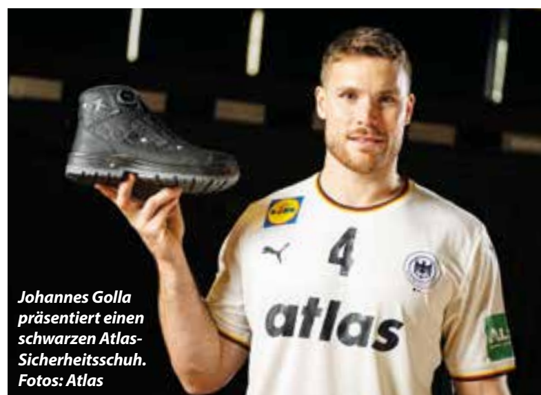
Johannes Golla präsentiert einen schwarzen Atlas-Sicherheitsschuh.