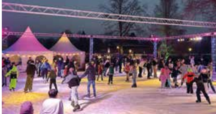
Die Eisfläche in Oelde ist gut besucht.

Die rund 500 Quadratmeter große Eisfläche oberhalb des Volksbank-Forums ist bereits zum 17. Mal ein winterlicher Treffpunkt. Der Besuch an der Eisbahn-Bande wird zu einem besonderen Erlebnis. Mit einer urigen Almhütte als Aufenthaltsort lassen sich gemütliche