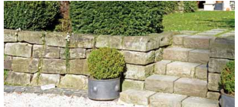
Für Höhenunterschiede im Garten sind Trockenmauern natürlich wirkende Trennelemente.

Ein grüner Rückzugsort, der den stressigen Alltag vergessen lässt: Das verbinden viele Menschen mit ihrem Garten. Gerne investieren sie daher Zeit und Ideen, um das private Refugium individuell zu gestalten. Besonders elegant wirkt es, wenn die Bepflanzung und die Befestigung fließend ineinander übergehen.