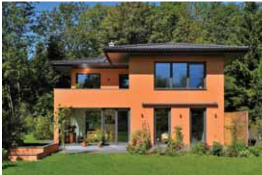
Massivholzmauer: aus wohngesundem Holz und dennoch massiv wie Stein. Foto: djd/Massiv-Holz-Mauer/Architekt Uwe Klose

Wer heutzutage einen Hausbau plant, hat nicht nur das selbst gesteckte Budget im Blick. Die Möglichkeiten sind vielfältiger geworden, denn neben dem traditionellen Massivhaus bieten sich weitere Alternativen an.