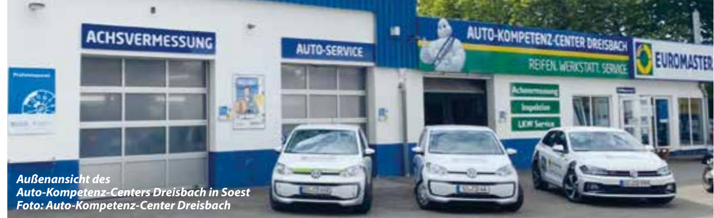
Außenansicht des Auto-Kompetenz-Centers Dreisbach in Soest