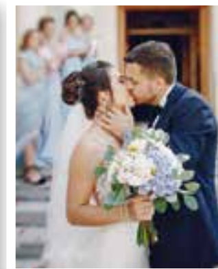
Soest Seite 8 19. Hochzeitsmesse