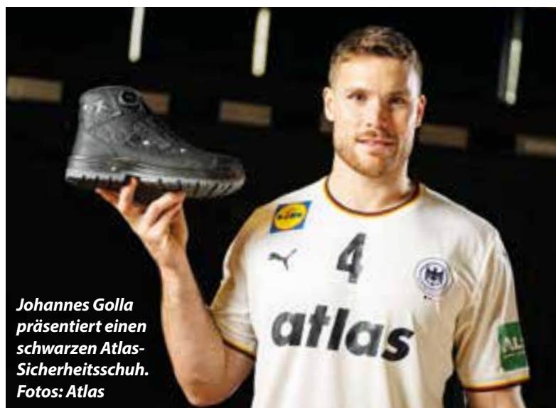
Johannes Golla präsentiert einen schwarzen Atlas-Sicherheitsschuh.