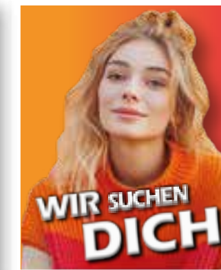
Azubi-Special Seite 20 Ausbildungsstellen