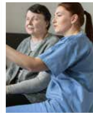
Exklusiv Seite 4 Behördenwahnsinn