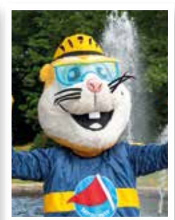
Seite 6 Sattelfest