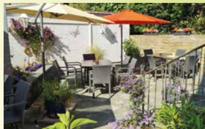
Neue Linde (Werl-Büderich): Gemütlichkeit pur und gutbürgerliche Küche, z. B. mit einem kühlen Blondem, sorgen für ein entspanntes, genussliches Beisammensein. Die besonders leckeren Schnitzel sollten Sie unbedingt probieren!