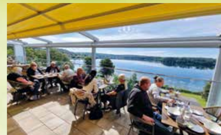
Pier20: Der einzigartige Panoramablick über den Mönesee besichert den Gästen, neben einer ausgesuchten Speisenauswahl und leckeren Drinks, Urlaubsatmosphäre pur. Ein Ambiente, das seinesgleichen sucht.