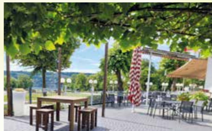
Haus Griese: Saisonale Köstlichkeiten, feinste Kuchen und kühle Erfrischungen erwarten Sie auf der von üppigem Grün umrahmten „Griese-Terrasse“ mit einem wunderschönen Ausblick über die Seetreppe bis auf den Mönesee.