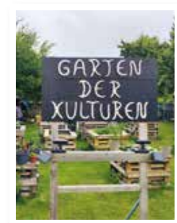
Seite 4 Garten der Kulturen