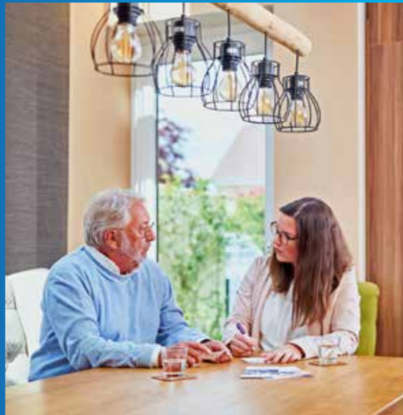
Eine Pflegeberatung hilft Betroffenen nicht nur bei der Organisation der Pflege, sondern bietet auch wichtige seelische Unterstützung.

Ein vielseitiges und sinnstiftendes Arbeitsfeld ist auch die Pflegeberatung, die für Pflegebedürftige und ihre Angehörigen oft unverzichtbar ist. „Pflegeberater und Pflegeberaterinnen unterstützen Pflegebedürftige und ihre Angehörigen bei allen Fragen rund um die Leistungen der Pflegeversicherung und die Organisation der Versorgung. Sie helfen, die Qualität der häus-