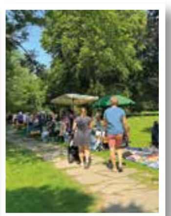
Seite 26 „Sonntag im Park“