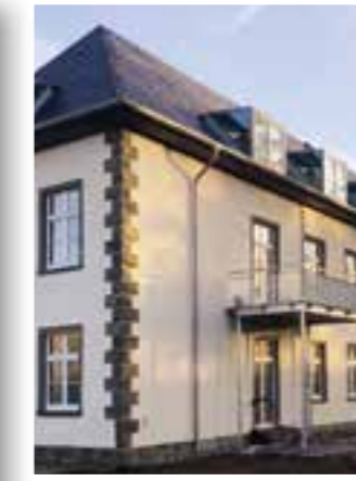
Seite 13 Tag der Architektur