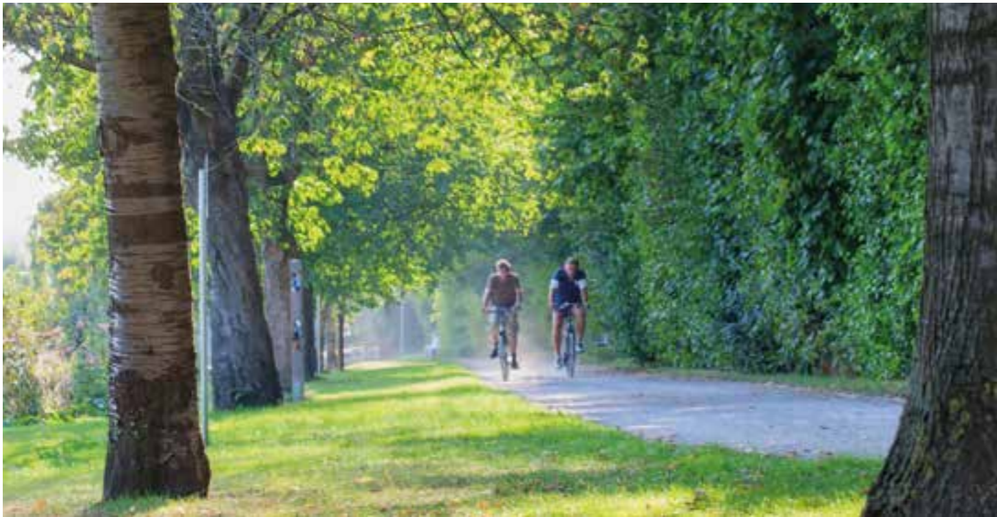
Bei einer Radtour kann man sich mit der Freizeit-App „TourInfo Kreis Soest“ über die schönsten und attraktivsten Strecken leiten lassen.

Infos zu Wander- und Radtouren sowie Sehenswürdigkeiten im Kreis Soest