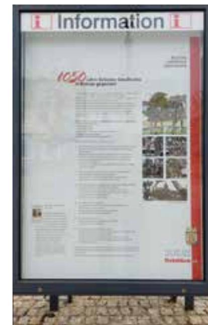
Das neue Info-Plakat am Belecker Wilkeplatz.

Neben den bereits genannten Aktionen sind noch Orientierungstafeln an der Stadtbücherei und gegenüber dem Ortsvorsteherbüro, ein Info-Schaukasten auf dem Mühlen-