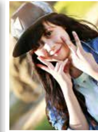
Seite 17 Ausbildungs-Spezial