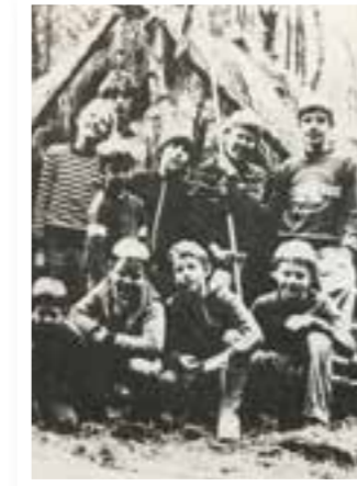
Seite 4 75 Jahre Pfadfinder