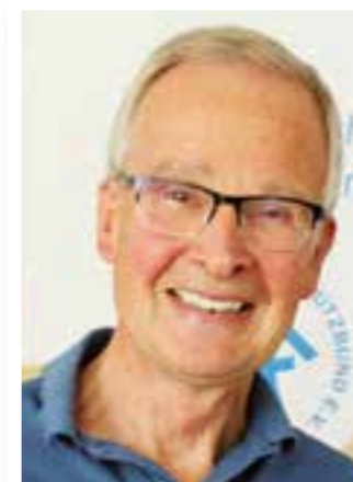
Seite 4 Kinderschutzbund Soest