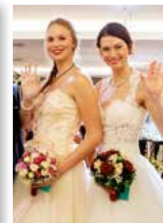
Seite 7 Hochzeitsmesse Soest