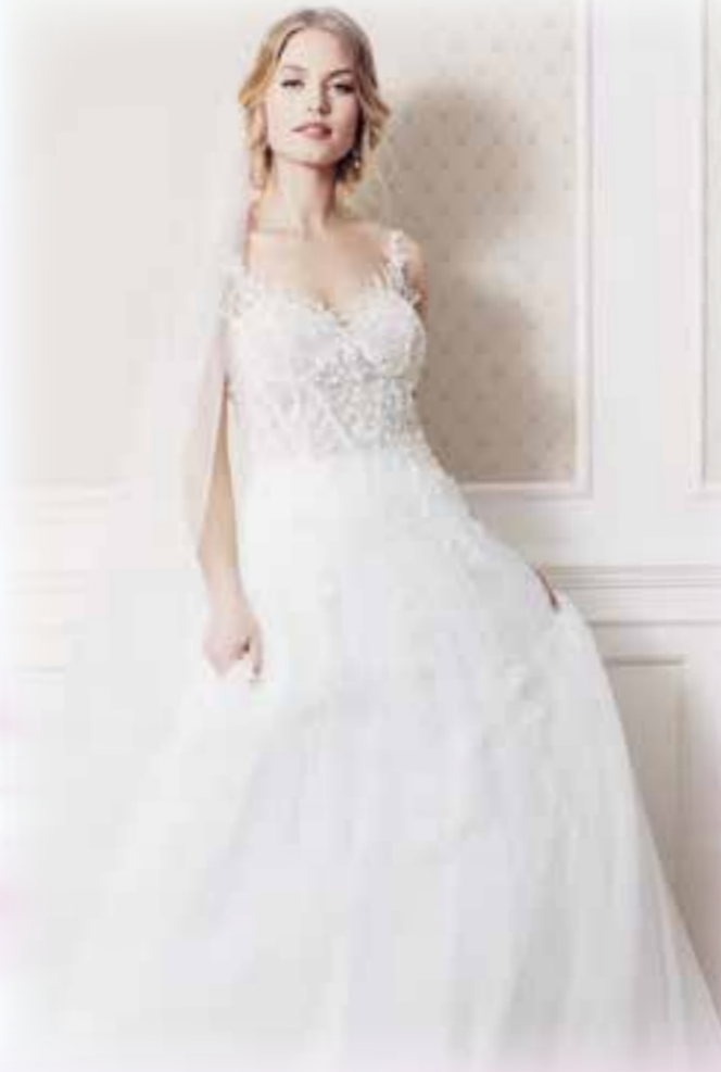
Brautmoden-Trends 2020: Viel Transparenz, verspielte Spitze und raffinierte Rückenlösungen.

terer bieten gern einen Probierhappen für den ersten Eindruck an.