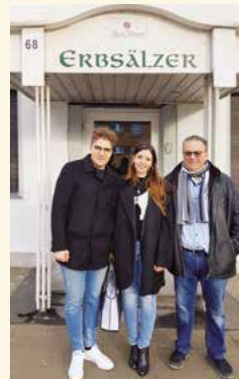
Ab Frühjahr 2020 heißen wir Sie in der Hammer Straße 68 herzlich willkommen!