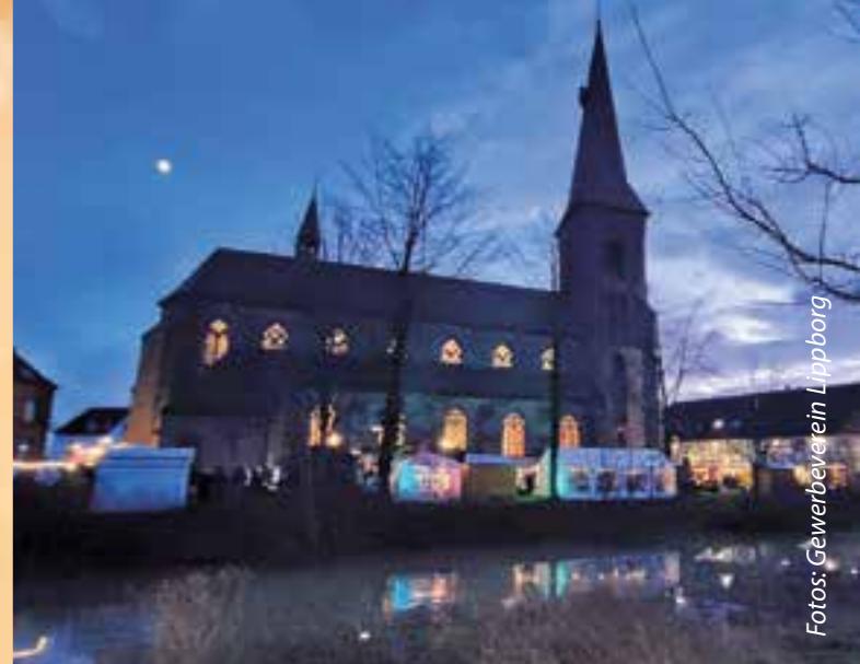
Der Weihnachtsmarkt Lippborg findet auf dem Kirchplatz statt.

„Wir freuen uns auf viele Besucherinnen und Besucher, die gemeinsam mit uns die besondere Atmosphäre des Lippborger Weihnachtsmarktes genießen. Unser Ziel ist es, einen kleinen, aber feinen Markt zu bieten, der die Gemeinschaft stärkt und echte Weihnachtsfreude verbreitet“, so der Gewerbeverein.