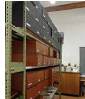
Alle Dokumente sind penibel archiviert.