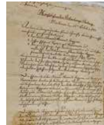
Viele Dokumente sind noch in Sütterlin-Schrift verfasst.