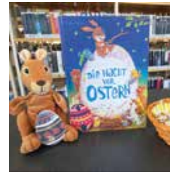
Bilderbuchkino / Die Nacht vor Ostern