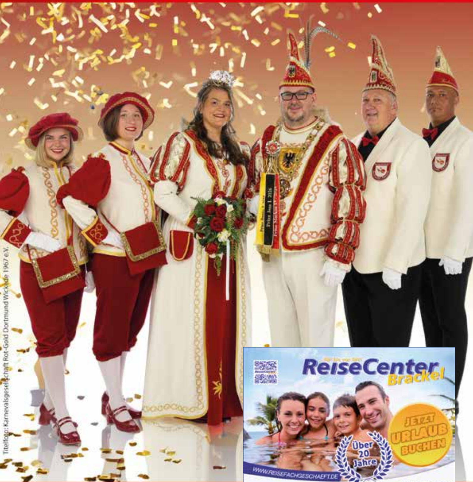
Titelfoto: Karnevalsgesellschaft Rot-Gold Dortmund/Wickede 1967 e.V.