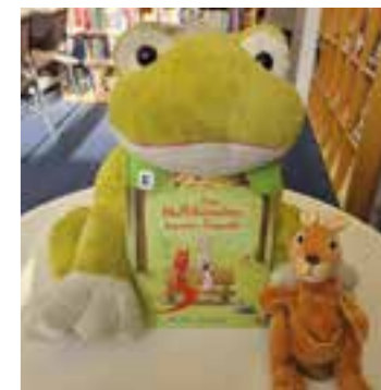
Bilderbuchkino / Auch Muffelhörnchen brauchen Freunde