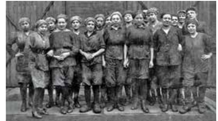
Zwischen Zeche und Familie

Der Alltag von Frauen im Bergbau ist bis heute ein wenig erforschter Bereich der Ruhrgebietsgeschichte. Am Beispiel