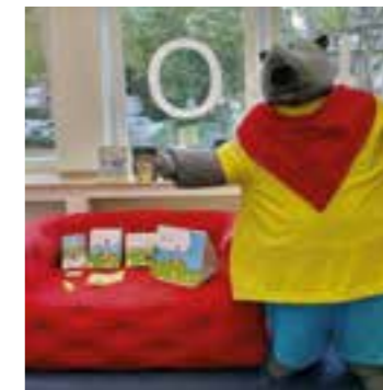
Vorlesestunde / Rotes Sofa

Mittwoch, 25. März Bilderbuchkino/ Die Nacht vor Ostern Der Osterhase hat es mal wieder vermasselt. Einen Tag vor Ostern fällt ihm auf, dass die Planung gehörig aus dem Ruder gelaufen ist. Es herrscht Chaos. Nur gut, dass er Freunde hat. Eitle Gockel, ein Haufen aufgeregter Hühner und ein in die Jahre gekommenes Osterlamm stehen ihm zur Seite, um das Unmögliche möglich zu machen. Erfahren Sie gemeinsam, wie die Nacht vor Ostern gemeistert werden kann. Die Veranstaltung ist kostenlos und beginnt um 16 Uhr in der Bibliothek Brackel. Es ist keine Voranmeldung erforderlich.