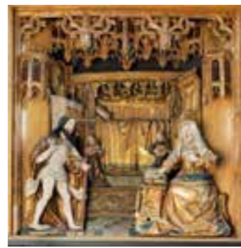
Kleider machen Leute

Zur Women's Week liegt der Fokus in der Ev. Stadtkirche St. Reinoldi auf der bekanntesten Frau des Christentums: Maria. Das um 1415 aus Brügge nach Dortmund exportierte Altarretabel im Chor der Kirche erzählt von den wichtigsten Stationen aus ihrem Leben. Unweit von dem Retabel finden wir eine Marienskulptur aus etwa der gleichen Zeit. Standort und Kostbarkeit dieser Werke zeugen davon, dass die Ratsherren, die im Chor der Kirche Platz nehmen durften, bewusst die Nähe zu Maria suchten. Ikonographie und Erzählungen aus dem Marienleben werden anhand dieser Kunstschätze unter der Leitung von Uwe Schrader lebendig er-