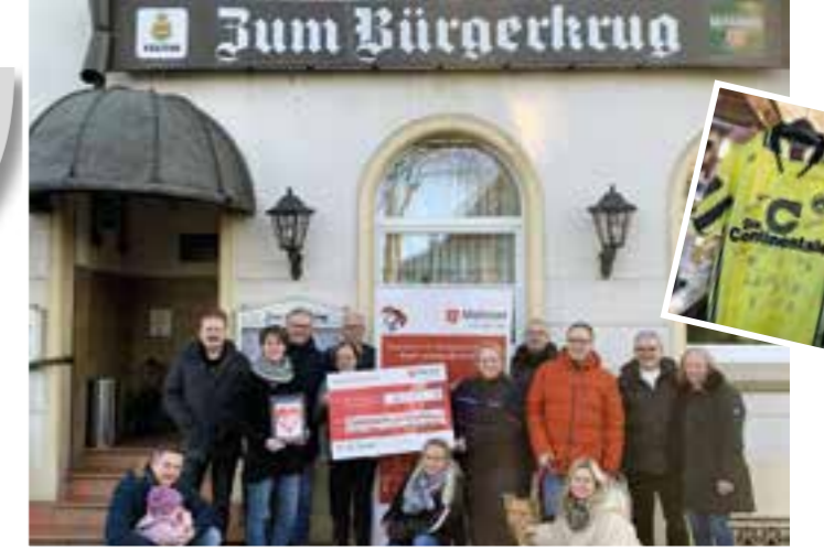
Text u. Fotos: Dietmar Stolcki

Spendenkasse immer mehr, womit abschließend ein Betrag von 8.155 € erzielt und an Frau Budde und Frau Sültemeyer übergeben werden konnte. Unüberhörbar war an diesem Abend die Frage, ob es auch in 2026 wieder solch einen tollen Adventszauber geben wird. In Anlehnung an Freddy Frinton und dem Dinner for one können wir sagen: „We do our very best...!“ Das gesamte Orga-Team war am Ende dieser schönen Veranstaltung geschafft, aber sehr beglückt und bedankt sich bei allen Gästen und Spendern sehr herzlich!