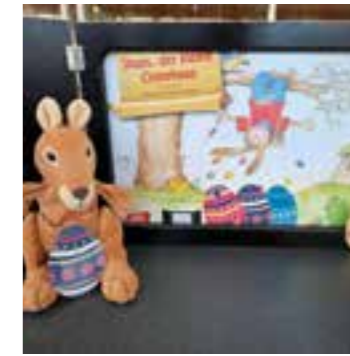
Kamishibai Erzähltheater / Stups, der kleine Osterhase