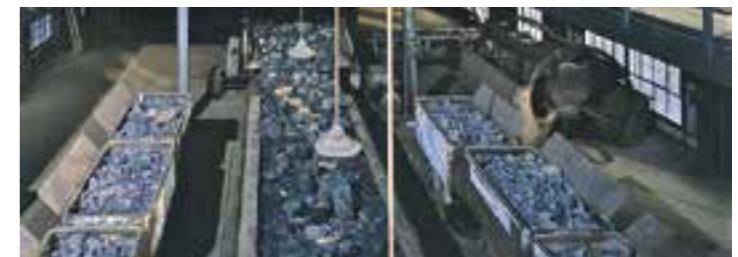
Wege der Kohle

und erfahren Wissenswertes über den Wandel der Bergbaulandschaft. Festes Schuhwerk wird empfohlen, Treffpunkt ist das Museumsfoyer, LWL-Museum Zeche Zollern. Die Veranstaltung startet um 14 Uhr und kostet für Erwachsene 8 Euro (in Gruppen ab 16 Personen jeweils 7 Euro) und ermäßigt 4 Euro.