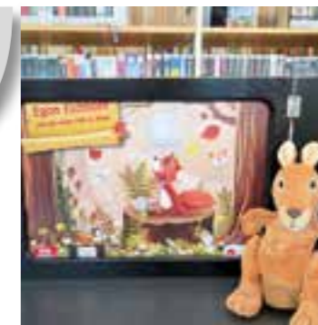
Kamishibai Erzähltheater / Egon Eichhorn & der wilde Müll im Wald

Mittwoch, 11. März Kamishibai Erzähltheater/ Stups, der kleine Osterhase Stups, der kleine Osterhase – er fällt andauernd auf die Nase. Stups hat es wirklich nicht leicht: Eigentlich soll er fleißig mithelfen, damit bis zum Osterfest alle Eier bemalt und versteckt sind. Leider ist er aber so ungeschickt, dass er von ei-