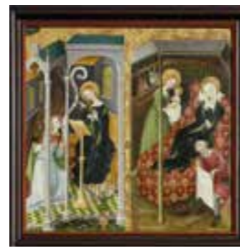
Mariendarstellungen in St. Reinoldi